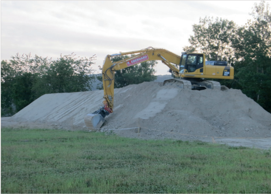
An verschiedenen Orten wurden künstliche Sand-schüttungen gebaut, mit denen unter anderem die Uferschwalbe gefördert werden soll.

vergangenen zwei Jahrzehnten im Kanton Zürich und in vielen anderen Landesteilen sehr selten geworden. Über die Ursachen kann derzeit nur spekuliert werden. Der Weg zu effektiven Schutzmassnahmen ist hier weit.