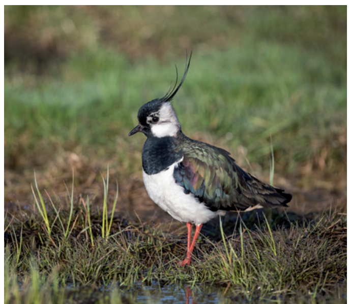
Nur dank gezielter Schutzmassnahmen brüten im Kanton Zürich noch wenige Paare des bedrohten Braunkehls (links). Und auch der Kiebitz ist auf intensive Begleitung durch den Artenschutz angewiesen.