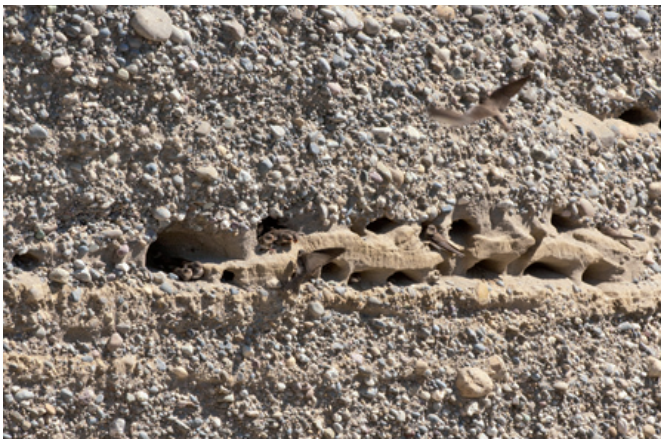
Trotz Fördermassnahmen haben die Bestände der Uferschwalbe (zu erkennen in den kleinen Löchern im Fels) im Kanton Zürich in den letzten Jahren abgenommen.

wenige Arten. Die Dohle hat im Kanton Zürich zugenommen dank gezielter Förderung mit Nistkästen. Auch Segler und Mehlschwalben akzeptieren künstliche Nisthilfen sehr gerne, und die Flussseeschwalbe brütet dank dem Installieren von Brutplattformen mittlerweile wieder an allen grösseren Zürcher Seen. Ihr natürliches Bruthabitat, ausgedehnte, ungestörte Kiesflächen an grossen Fließgewässern, gibt es bei uns schon lange nicht mehr.