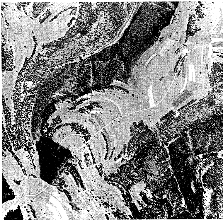
Aufnahme ca. 1940 Hegen-Randenhorn-Cheisental Merishausen SH. Später fehlen etliche Bäume.

Angaben zum Vorkommen der Heiderleerche im Kanton Schaffhausen reichen bis ins 19. Jahrhundert zurück (GOELDIN 1879). Mit wenigen Ausnahmen stammen alle älteren und neueren Meldungen aus dem Randengebiet (Tagebücher von Carl Stemmler, NOLL 1965, BIBER 1984) und dort